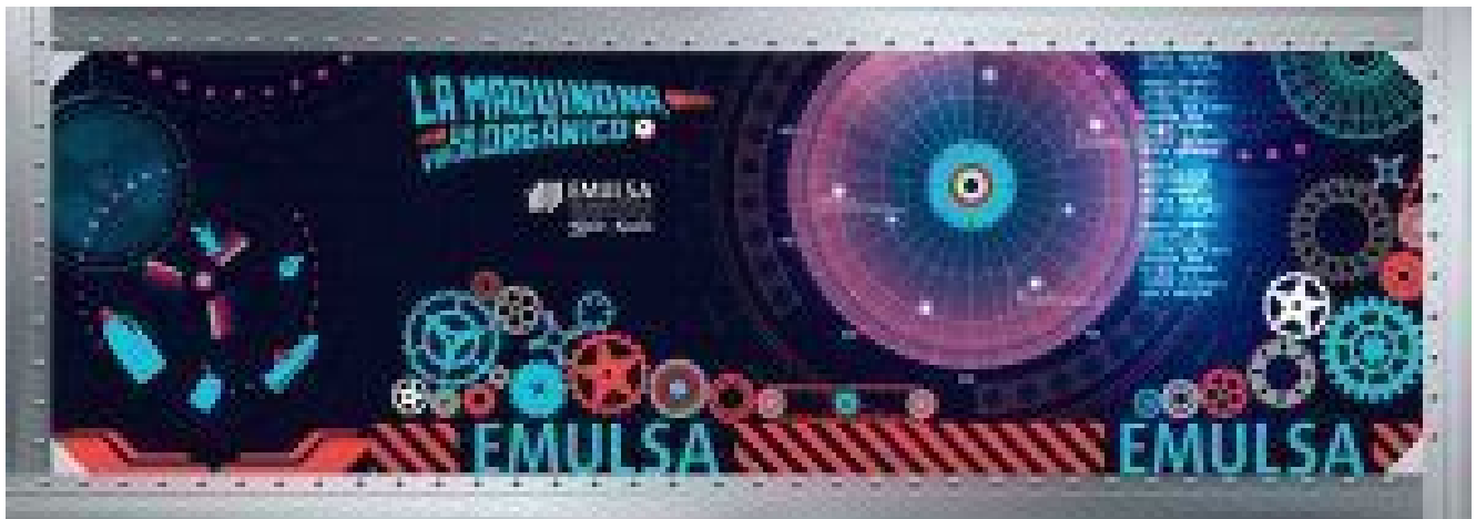
Panel modular anterior. Ventiladores, mecanismos, más palancas y Matrix.