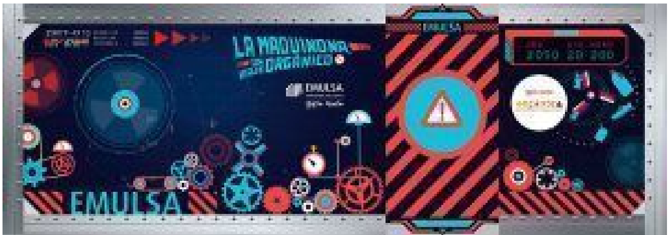
Panel modular frente de entrada, con puerta corredera a lo Star Wars. Eso sí que sí.