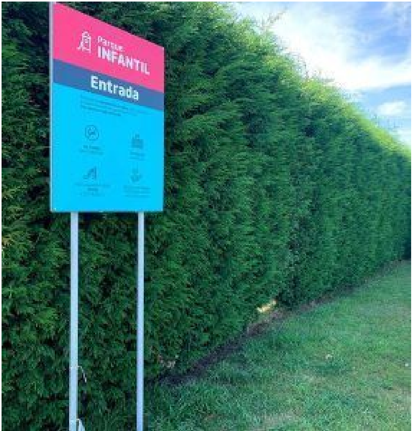
Entrada al parque infantil y normas de convivencia y su uso.