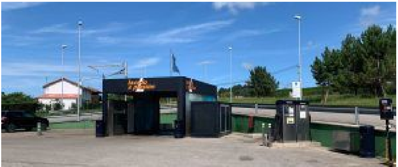
Lavado a presión. La joya de la corona.