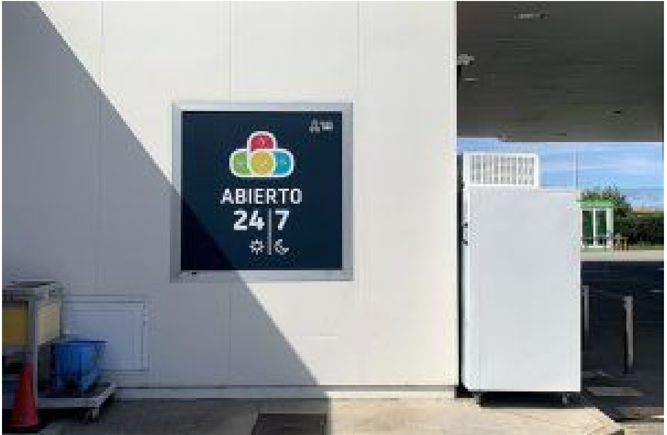
Ventana lateral de horario de apertura.