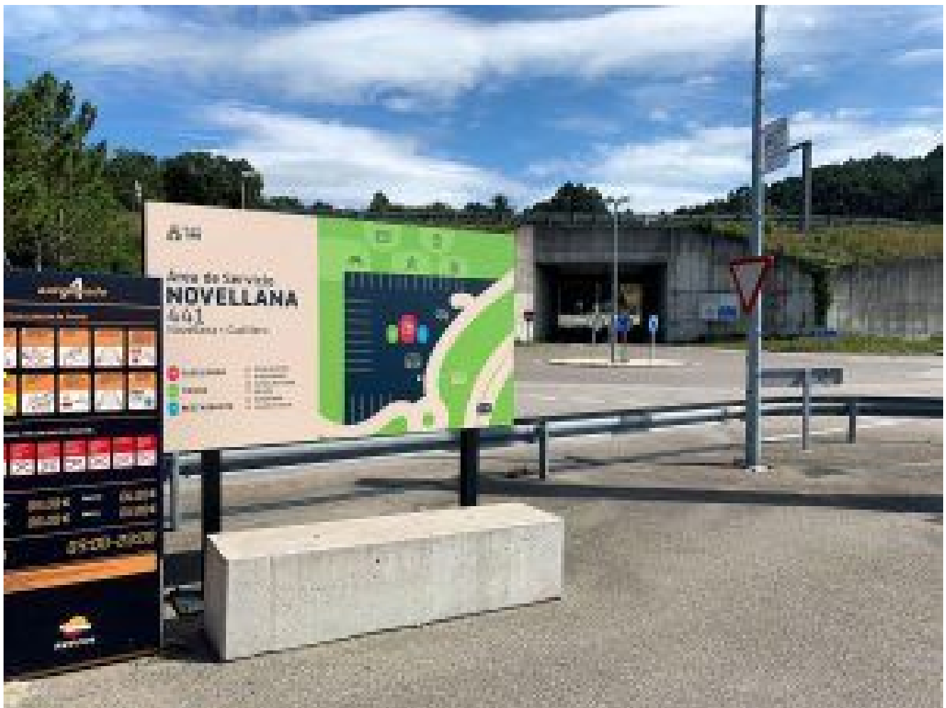
Plano de situación y ubicación en la entrada de la estación.