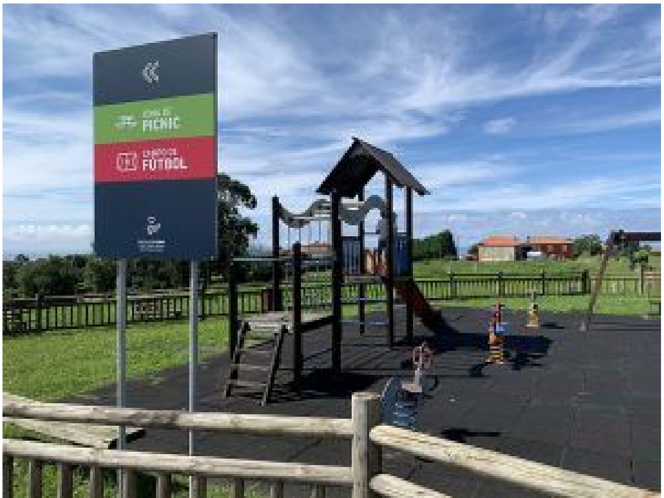
Indicaciones para las otras zonas de recreo.