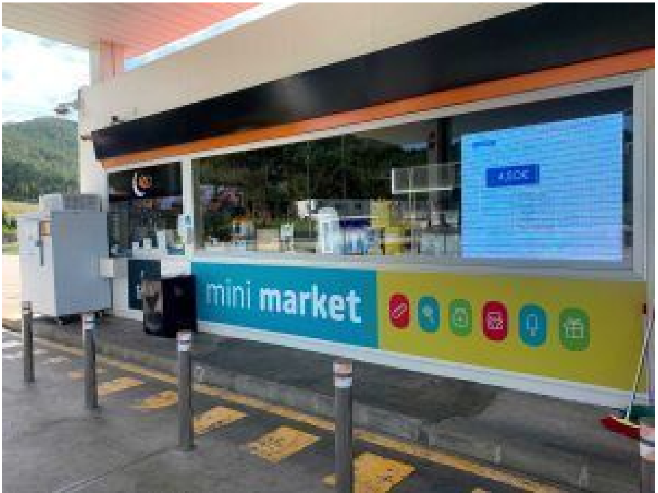
Súper banner del minimarket y caja nocturna.