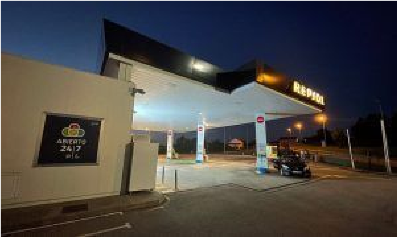
Estación de servicio de Novellana Salida 441. Cudillero.

Proyecto: Identidad corporativa y paneles de señalización para Grupo Uro en su estación de servicio de Novellana, Asturias.