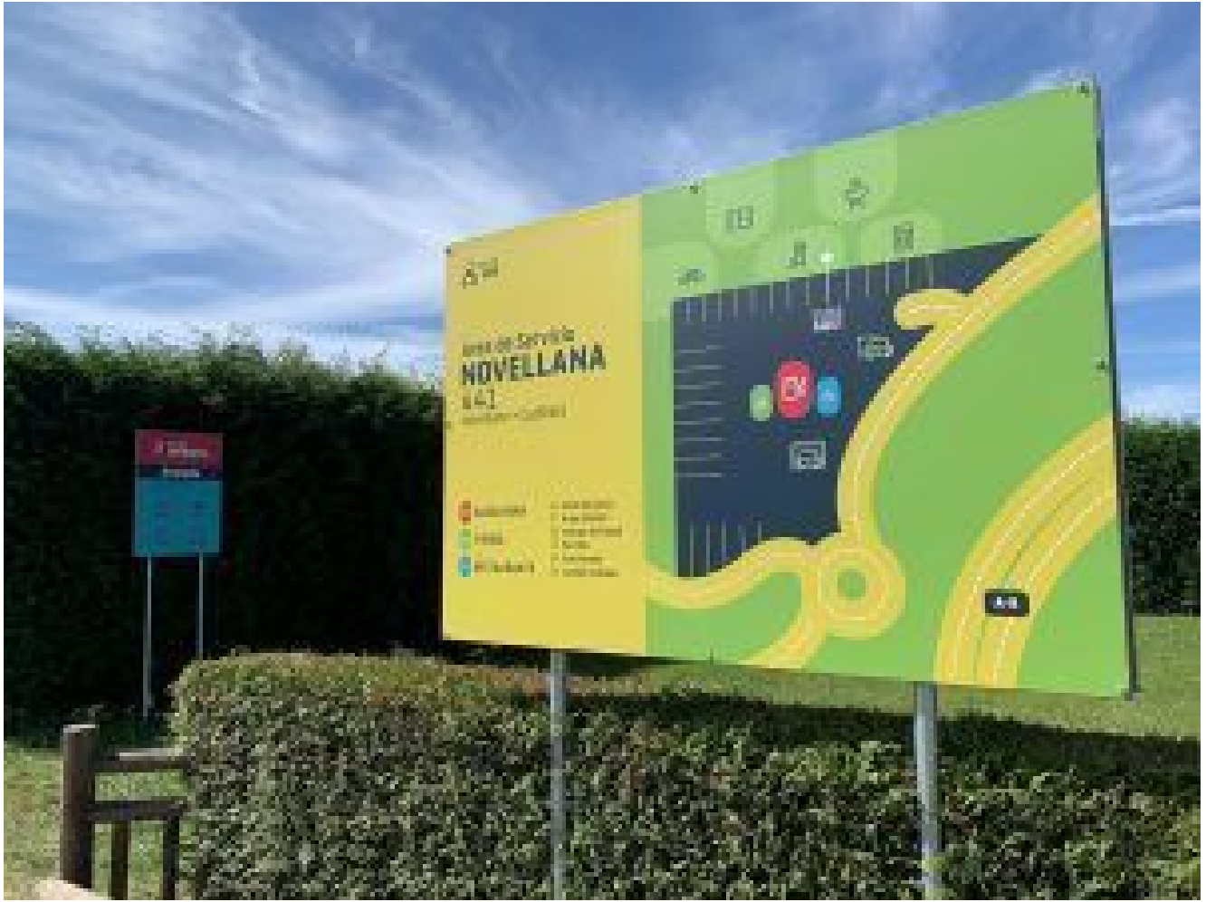
Plano de situación y ubicación dentro de la estación.