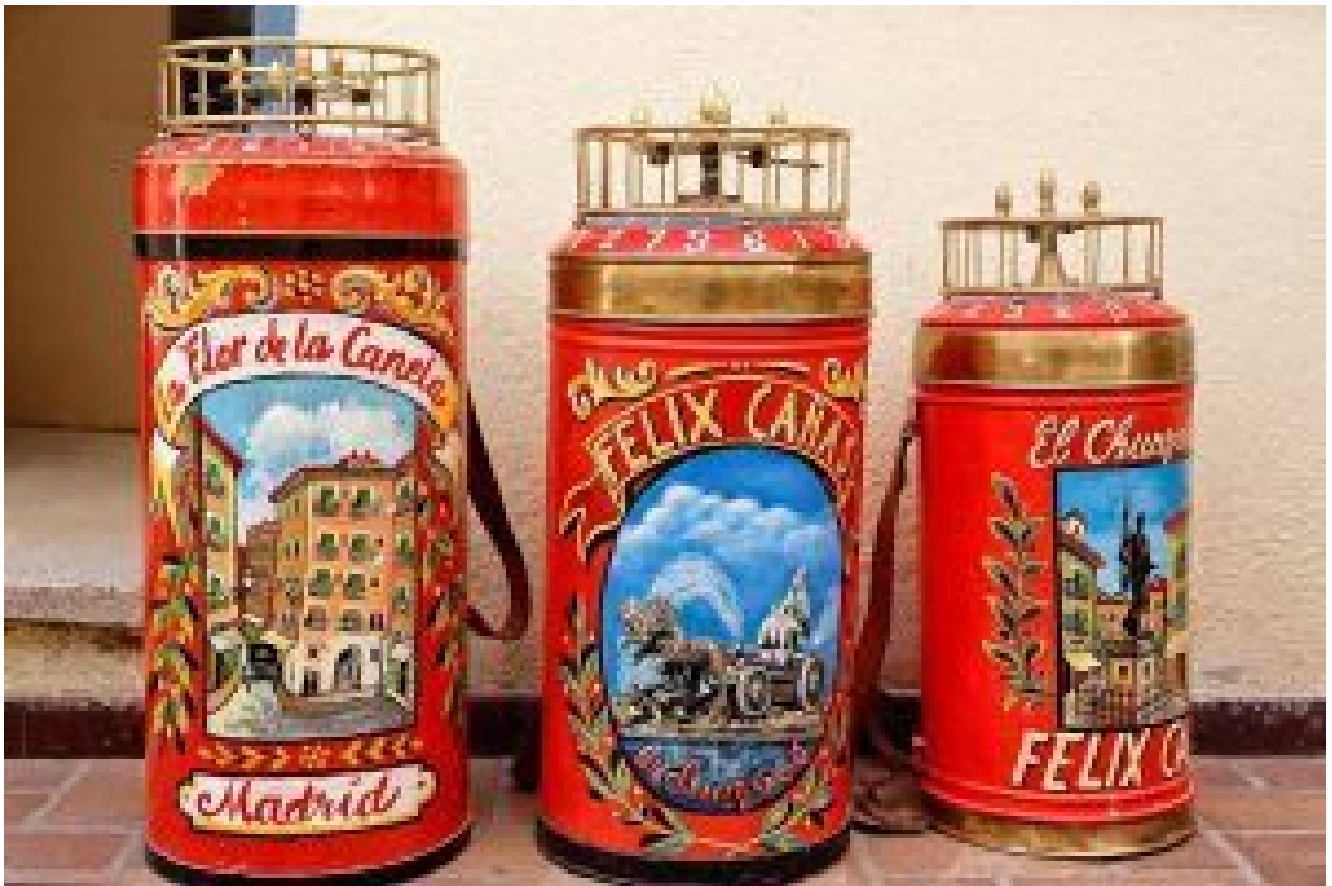
Algunas latas barquilleras con decoraciones varias.